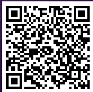
Details of "SME Export Marketing Fund" 「中小企業市場推廣基金」詳情