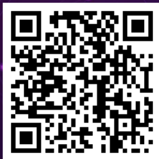
Application Form 申請表格