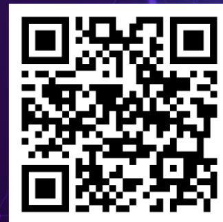
Online Application Form 網上電子申請表格