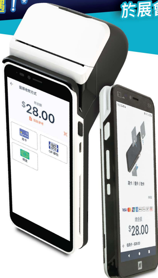
智能 POS S1